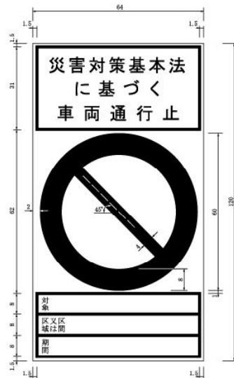
別記様式第2（第5条関係）